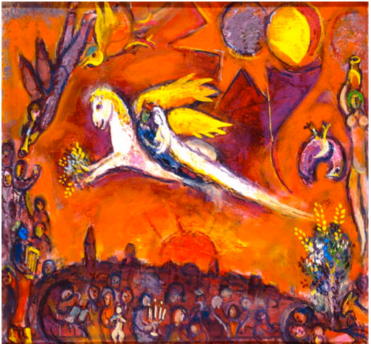
Le Cantique des Cantiques – Chagall

Tous nos Vœux de Bonheur Et de Véritable Amour